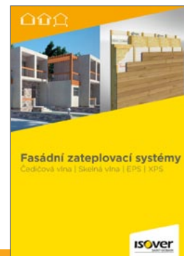
Detailní popis aplikace výrobku je uveden v katalogu ISOVER Fasádní zateplovací systémy

1. 9. 2017 Uvedené informace jsou platné v době vydání technického listu. Výrobce si vyhrazuje právo tyto údaje u všech listů aktualizovat.